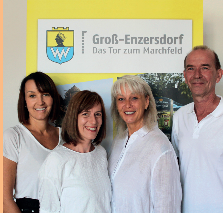
Community Nurse Team Groß-Enzersdorf